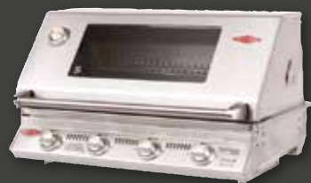
SIGNATURE 3000SS – 4 Brenner