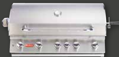
BRAHMA BUILT-IN – 5 BRENNER