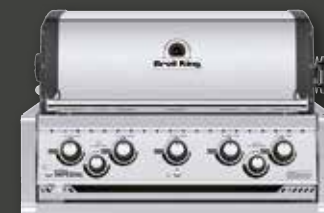
IMPERIAL 590 BUILT IN