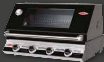
SIGNATURE 3000E – 4 Brenner