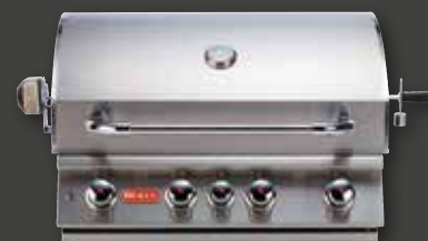
ANGUS BUILT-IN – 4 BRENNER