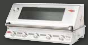
SIGNATUR S3000SS/3000E – 5 BRENNER